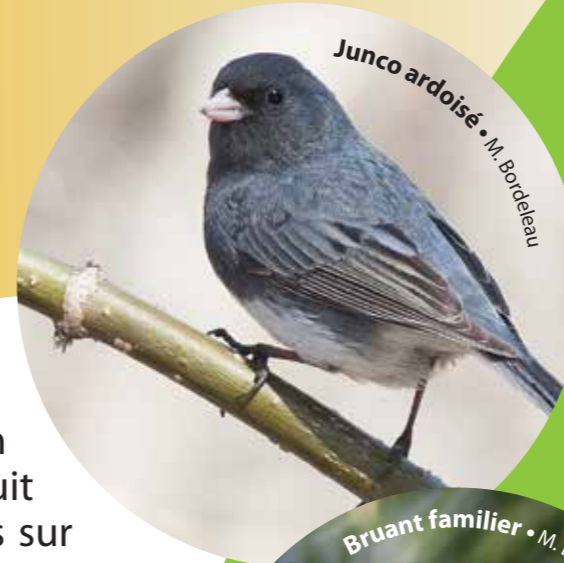
Junco ardoisé • M. Bordeleau