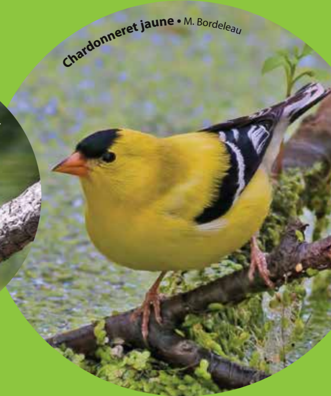
Chardonneret jaune • M. Bordeleau

Bruant familier Le bruant familier change de plumage petit à petit au cours de l'année. Les plumes de la face et de la gorge changent jusqu'à six fois par an. Les plumes du corps sont remplacées seulement une ou deux fois pendant la même période. Il peut vivre jusqu'à neuf ans.