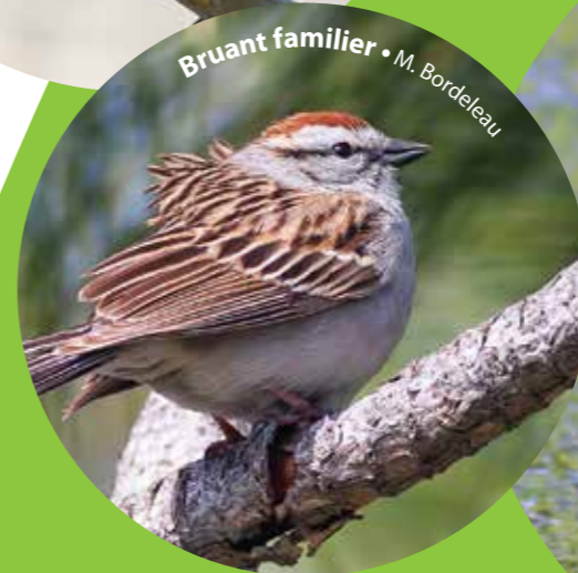
Bruant familier • M. Bordeleau