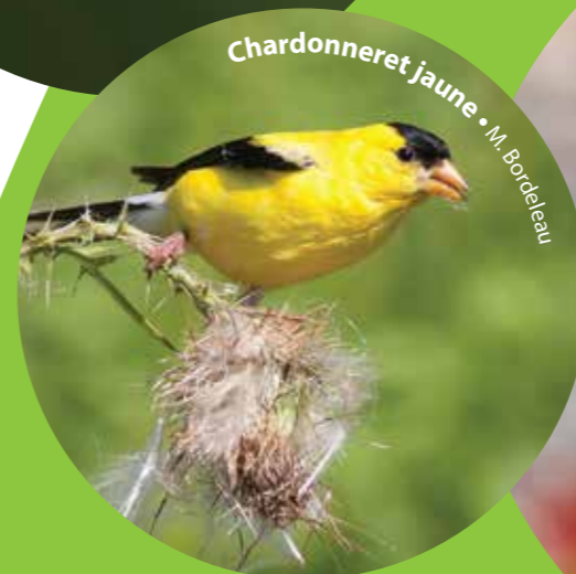
Chardonneret jaune • M. Bordeleau