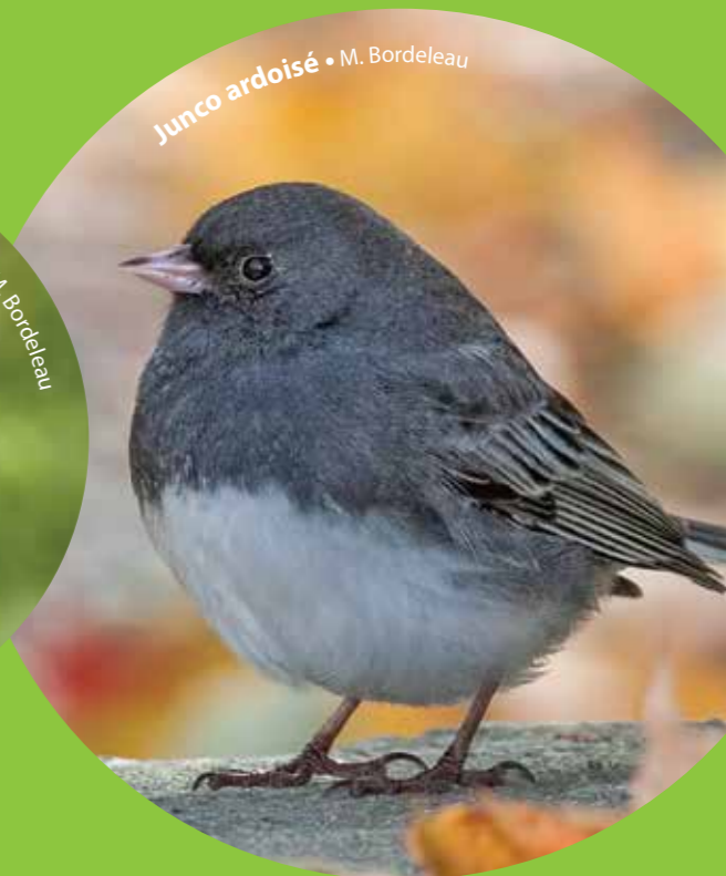
Junco ardoisé • M. Bordeleau