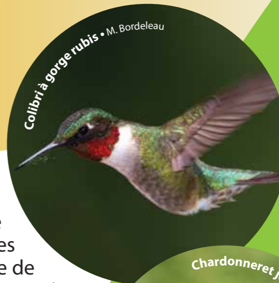
Colibri à gorge rubis • M. Bordeleau