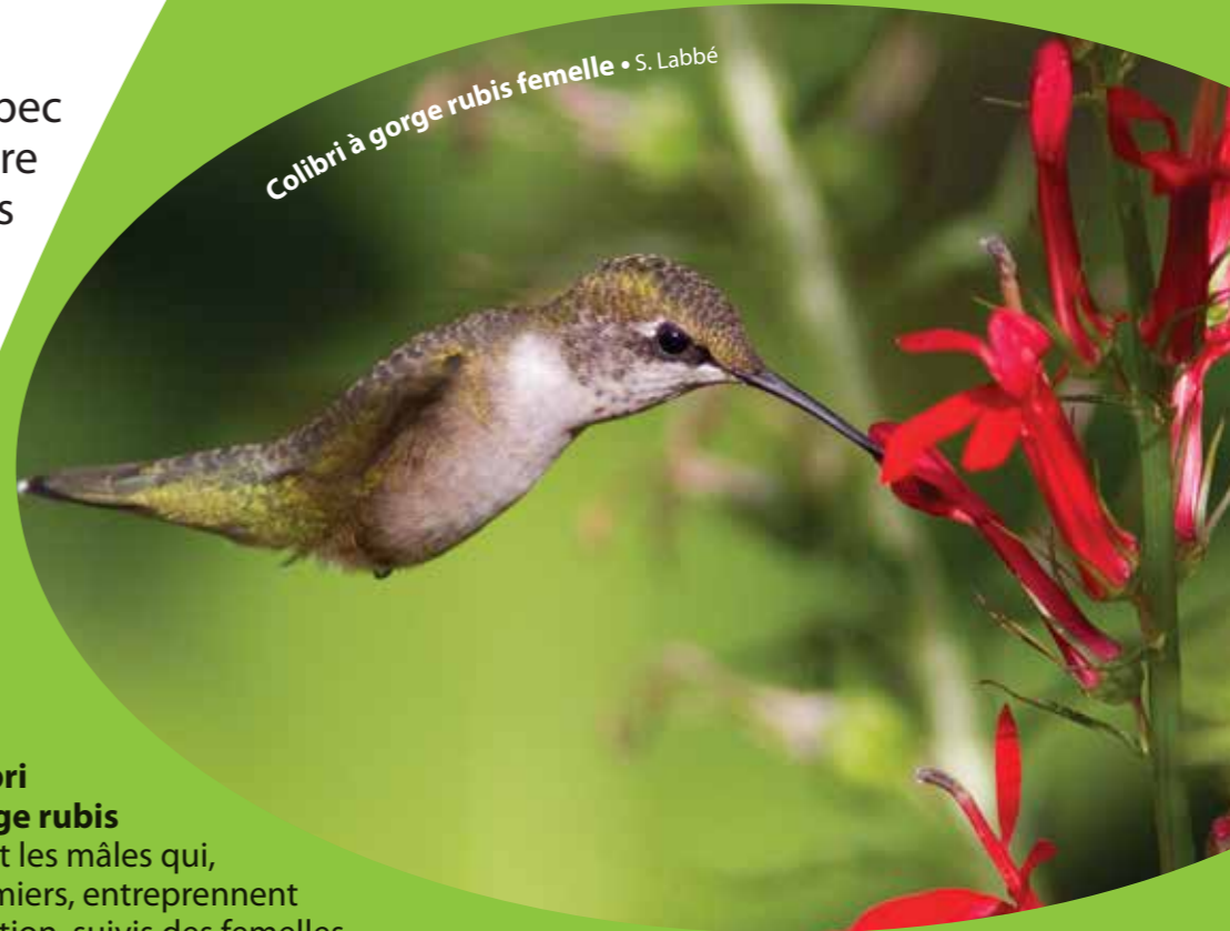
Colibri à gorge rubis femelle • S. Labbé