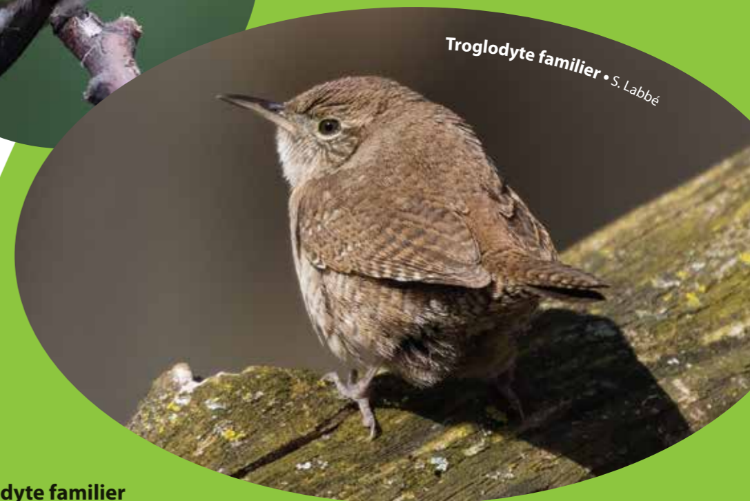
Troglodyte familier • S. Labbé