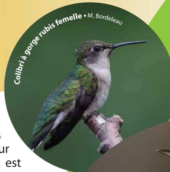
Colibri à gorge rubis femelle • M. Bordeleau