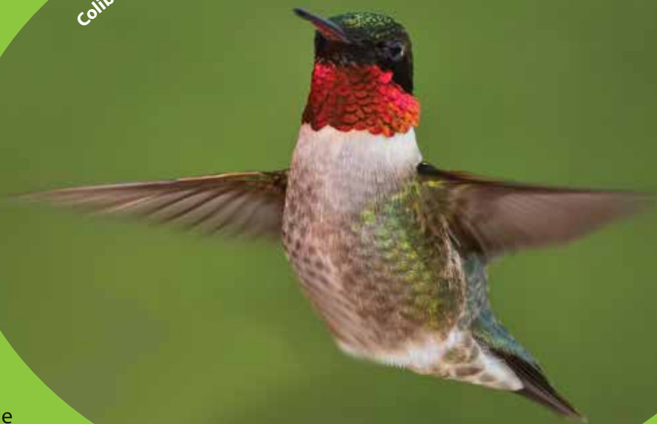
Colibri à gorge rubis • M. Bordeleau