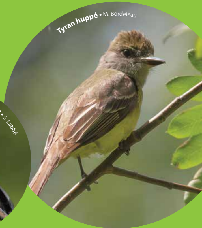
Tyran huppé