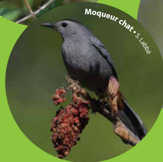
Moqueur chat • S. Labbe